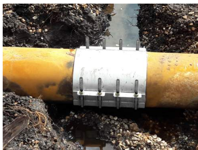
Dopo la riparazione